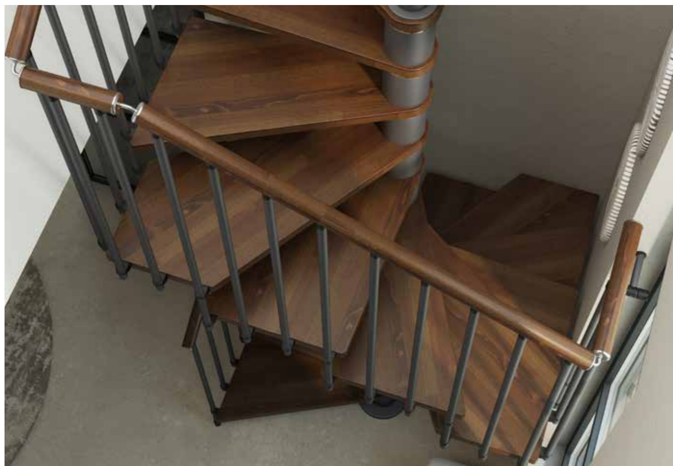
Dettaglio forma gradini e ampiezza pedata. Gradini e corrimano a colonnine verticali Noce 25, ringhiera e struttura Grigio Antracite 03. Detail of the shape of the steps and tread size. Steps and banister with vertical spindles in Walnut 25, handrail and structure in Anthracite Grey 03.

Square spiral staircase. 14 Walnut 25 wooden steps, banister and structure in Anthracite Grey 03 painted steel.